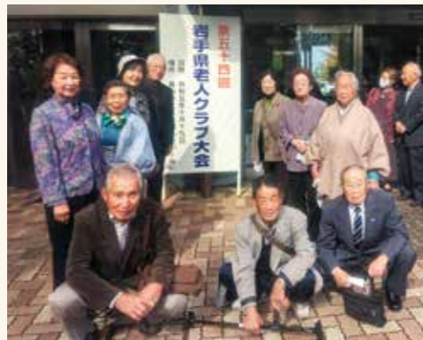
第54回岩手県老人クラブ大会 令和5年10月19日(木) 奥州市文化会館「Zホール」