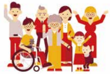
※戸別募金・法人募金・街頭募金は令和6年3月号でご報告致します。

10月1日から始まりました「赤い羽根共同募金運動」は、戸別募金のほか、町内の各種法人、商店、団体、学校の皆様からもご協力を頂き継続実施中です。その一部をご報告いたします。