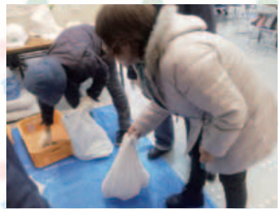
【土嚢詰め体験】石などを土嚢袋に詰めました。

津波で汚れた写真の洗浄・デジタル化を受け付けております。直接、写真をお持ち下さい。また、デジタル化希望の方は、受け取りの際にSDカードまたは、USBをお持ち下さい。 ※申込が多数の場合は、返却までにお時間がかかりますので、ご了承下さい。 写真は、思い出写真展にて、随時展示しています。