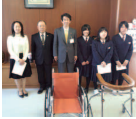
3月28日贈呈式が行われました。

山田中学校より、車椅子と歩行器を寄贈いただきました。山田中学校から町長へ、町長から社協会長へ託されました。