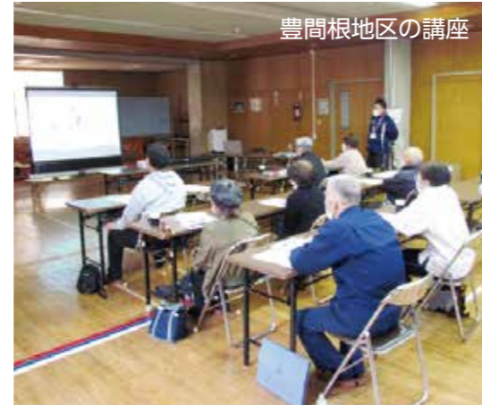
豊間根地区の講座

来年度もボランティア養成講座を行う予定です。今後も地域で支え合える町を作って行くために皆様の参加をお待ちしています。