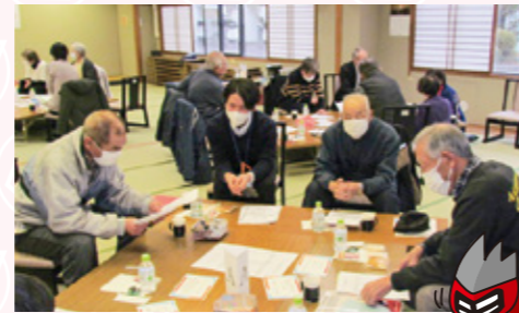
ぺんこさんの皆さん いつも活動頂きありがとうございます。

参加された方からは、「時間が足りなかった」「もっと他の方と交流したかった」「また交流会をやって欲しい」等の感想を頂きました。