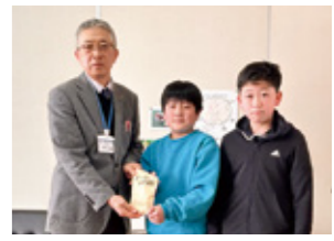
学校募金：豊間根小学校様